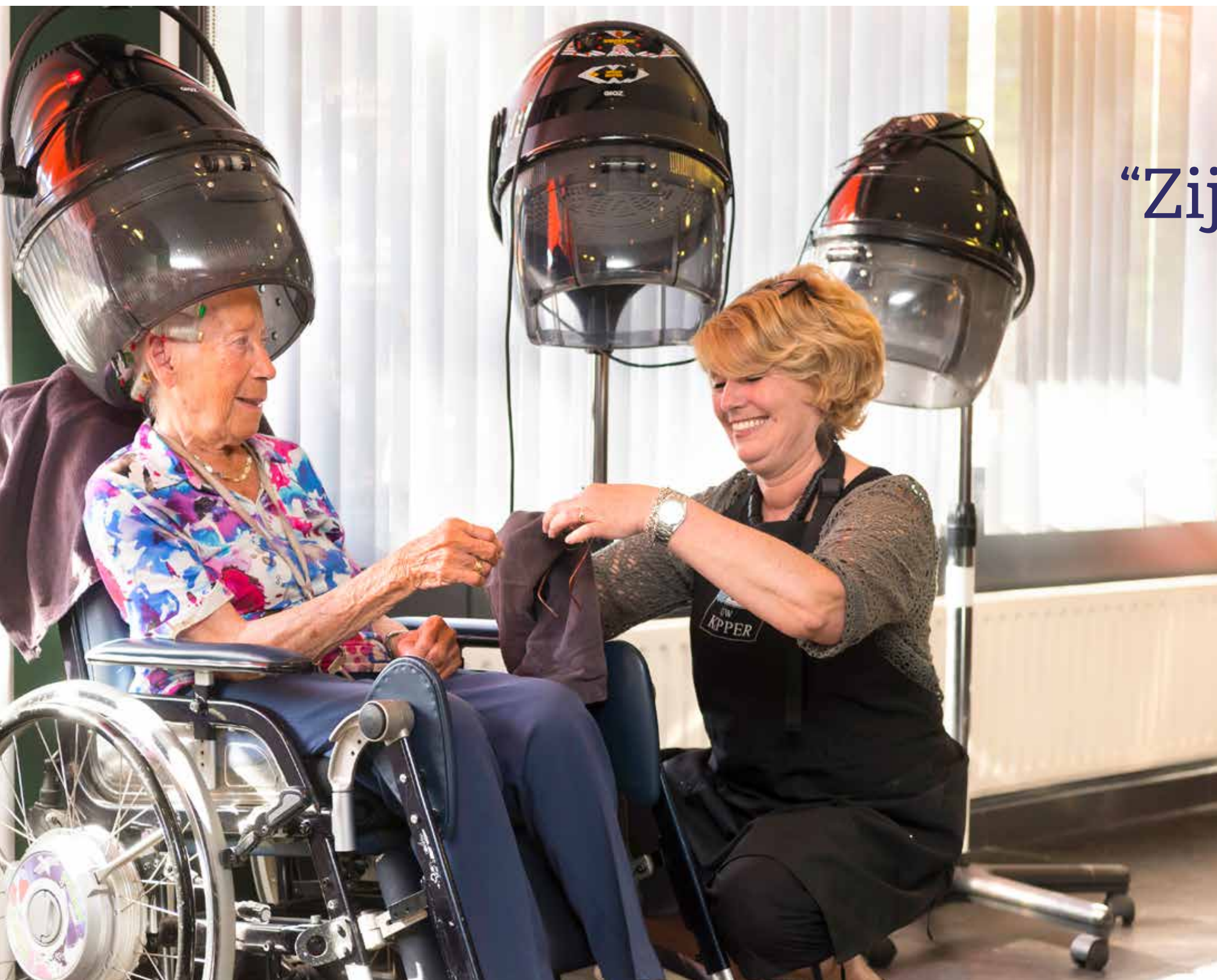
ZOR GKAPPER YVONNE HELPT EEN VAN HAAR KLANTEN.