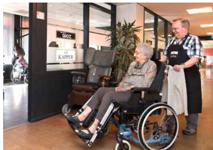
KLANTEN VAN QIOZ WORDEN IN HUN KAMER OPGEHAALD EN NAAR DE SALON GEBRACHT.

voor. Mensen zijn zichzelf niet meer. Je bent bij ons dus meer dan alleen een kapper, met werkzaamheden die in de buurt komen van (psychische) zorgverlening. Daar moet je wel tegen kunnen. Voor sommige kappers is dat een roeping. Ontzettend knap vond ik het bijvoorbeeld hoe een van onze medewerkers begrip toonde voor de vrouw die haar hard gekrabbd had. ‘Ach’, zei ze, ‘dat deed ze niet expres.’ Gelukkig hebben we ook hulpmiddelen om het werk lichamelijk wat minder